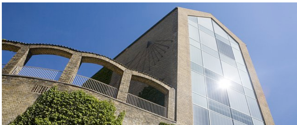
Aarhus Universitet.

Kronikken nødvendiggør en præcisering af sagsforløbet: